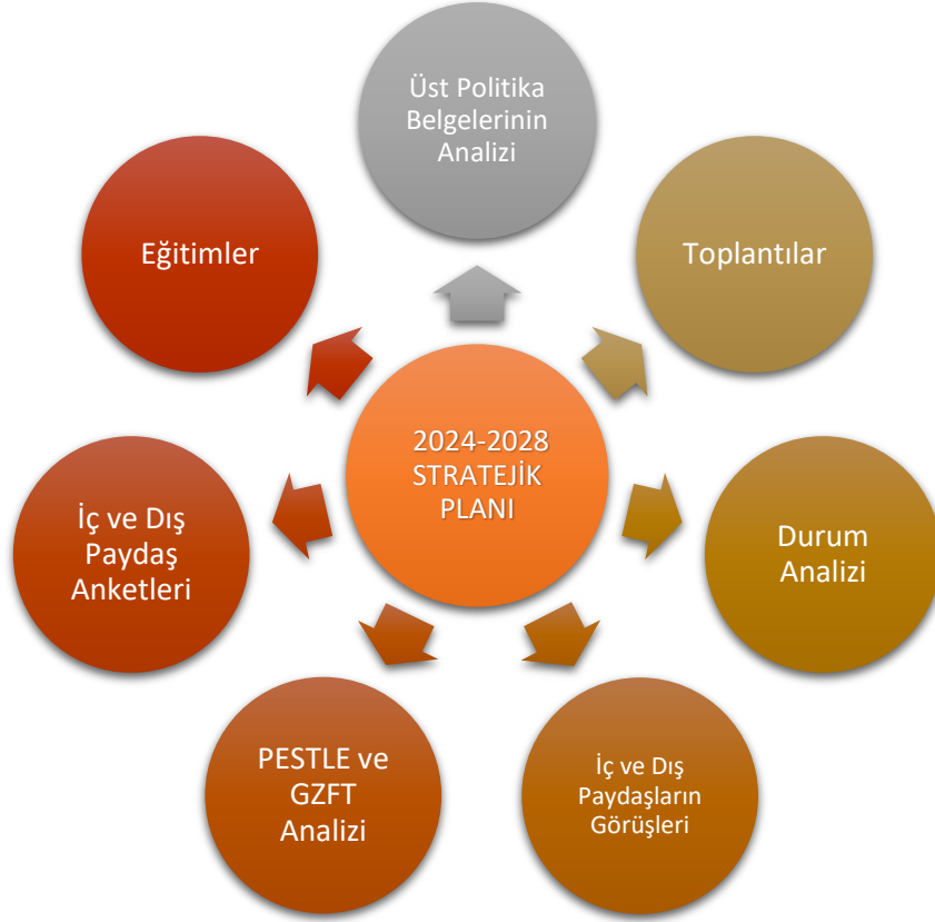
Şekil 1. Stratejik Plan Hazırlık Aşamaları

Bakanlığımız 2022/21 sayılı Genelgesi kapsamında Stratejik Planlama Ekipleri oluşturulmuş ve planın sahiplenilmesi sağlanmıştır. Hazırlık döneminde planın tüm birimlerce sahiplenilmesi, planlama sürecinin organizasyonu, ihtiyaçların tespiti, zaman planlaması gibi unsurlar ve durum analizinin yöntemleri ile geleceğe bakış kısmını oluşturan misyon, vizyon ve temel değerler kavramları gibi ana hatlar yer almaktadır. Hacıahmetoğlu Ortaokulu Müdürlüğü 2024–2028 Stratejik Planı; literatür taraması, toplantılar, durum analizi raporu (üst politika belgelerinin analizi, mevzuat analizi, faaliyet alanları ile ürün ve hizmetlerin belirlenmesi, PESTLE ve GZFT analizleri uygulanmakta olan stratejik planın değerlendirilmesi, iç ve dış paydaşların görüşlerinin alınması, kuruluş içi analiz ile tespit ve ihtiyaçların belirlenmesi) doğrultusunda hazırlanmıştır